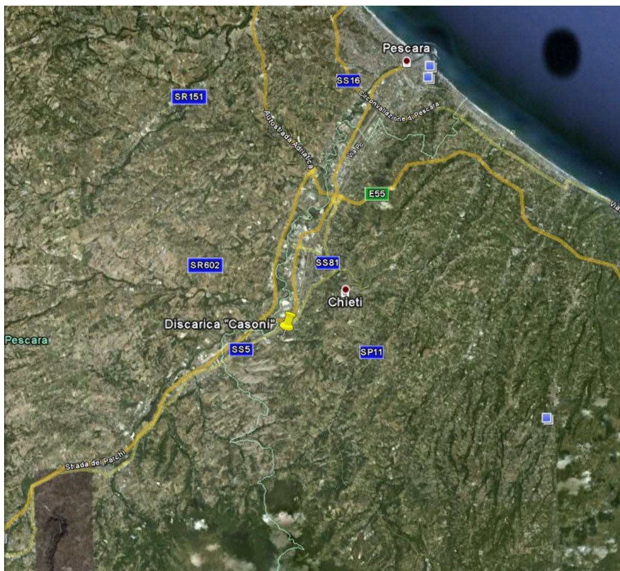
Figura 1 – Ubicazione geografica della discarica

La discarica si trova nel Comune di Chieti in località Casoni. L'impianto è circondato da terreni agricoli e si trova a circa 1 km a Sud-Est del casello autostradale di Chieti sull'autostrada A25.